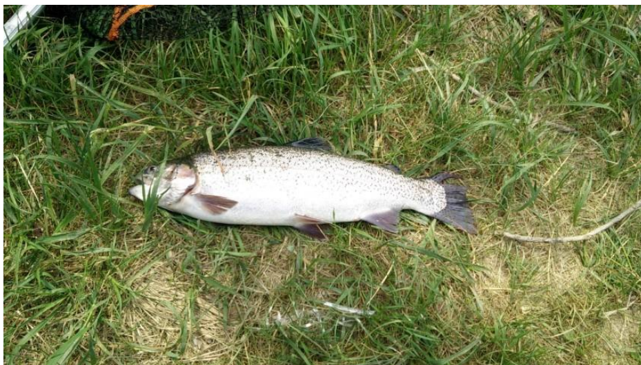
Regnbueørred fanget under put and take konkurrencen i maj