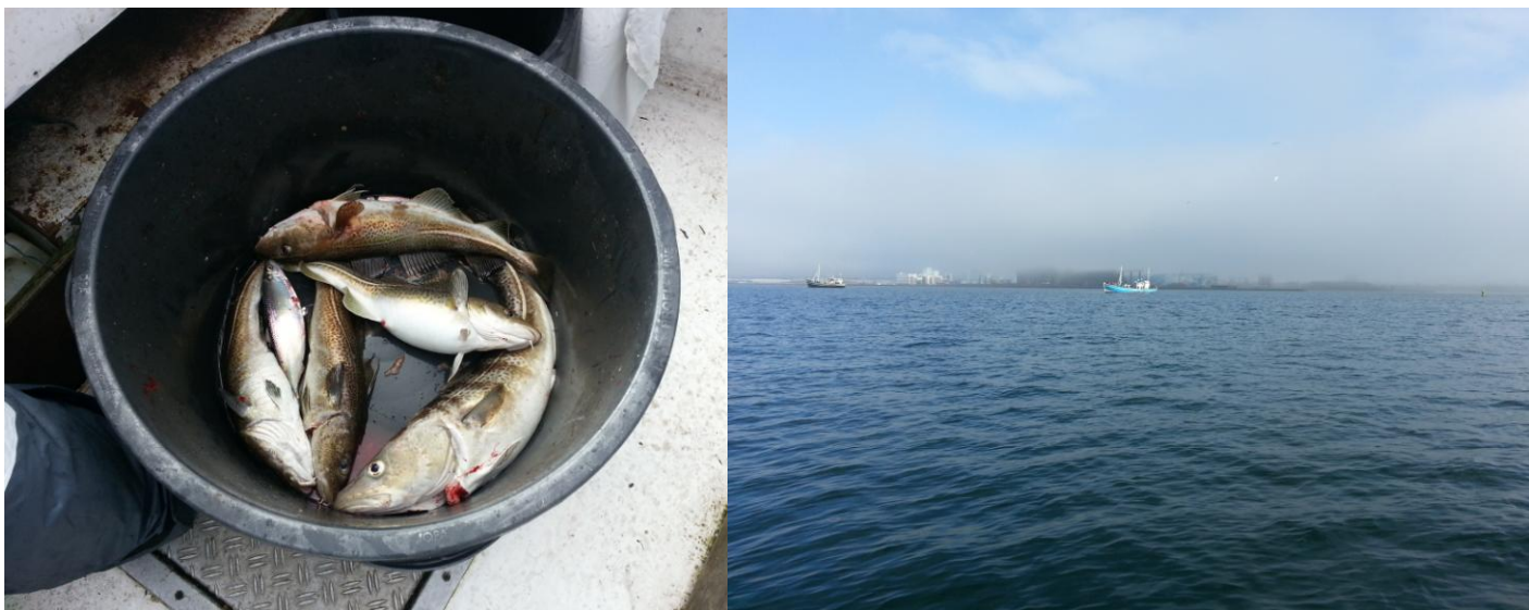
Forårstur med Janus

Tilmelding til Claus Hummel senest ugedagen før arrangementet