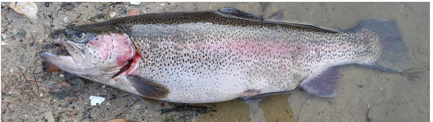
Regnbueørred 1,9 kg. Fanget den 14. Oktober 2014, i Store Rosenbusk Put & Take af Allan Vitting