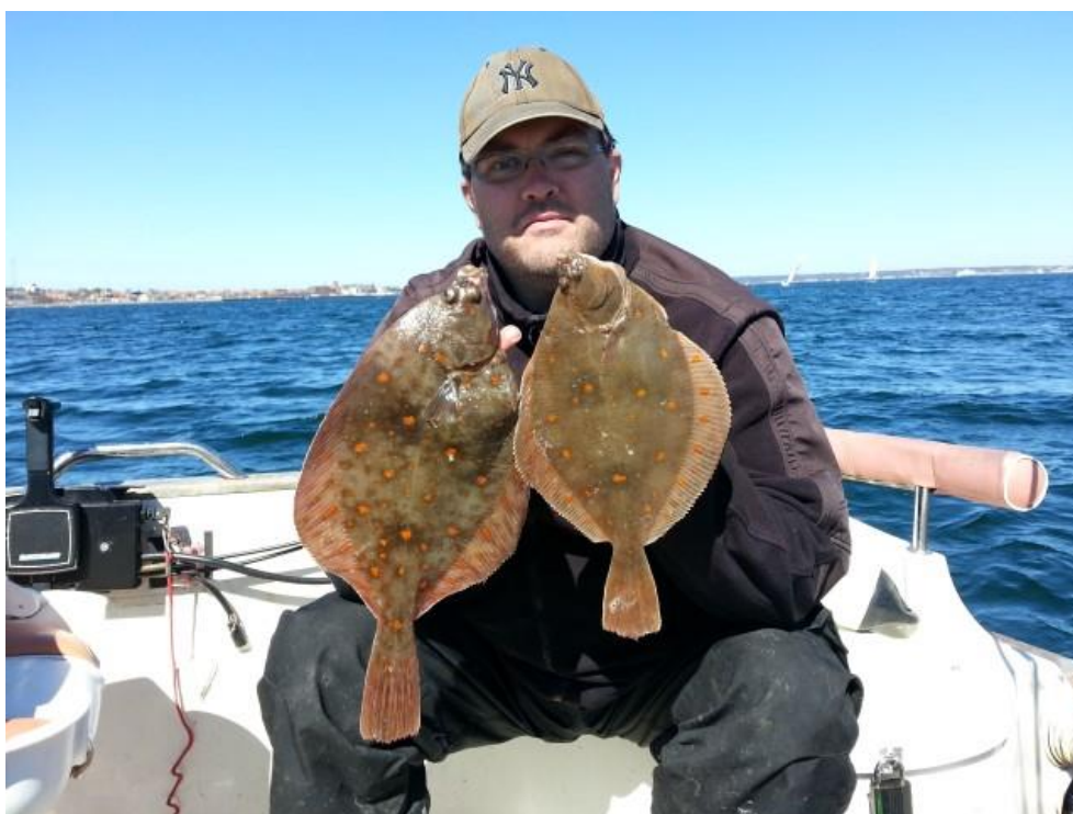
Rødspætter på 450g og 720g 2 ud af dagens 41 fladfisk