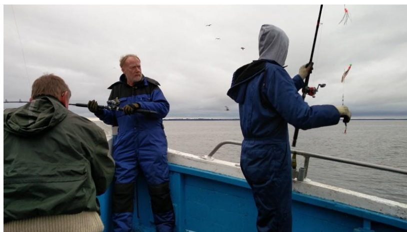
Havturen i Oktober