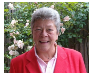
Foto Collage fra skovturen 2010