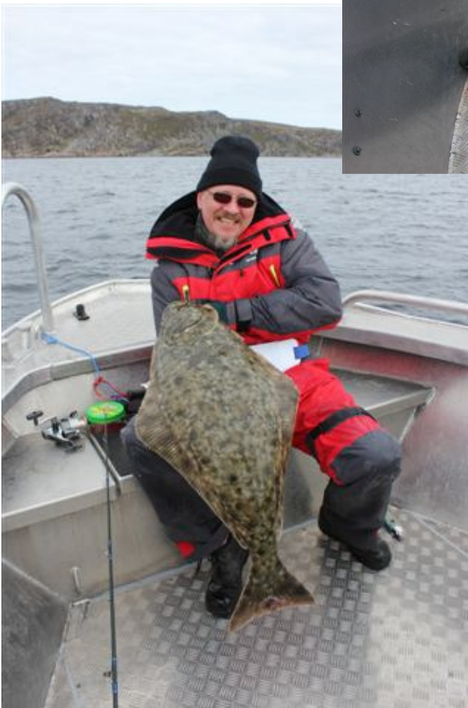
Oles helleflynder på 12 kg.