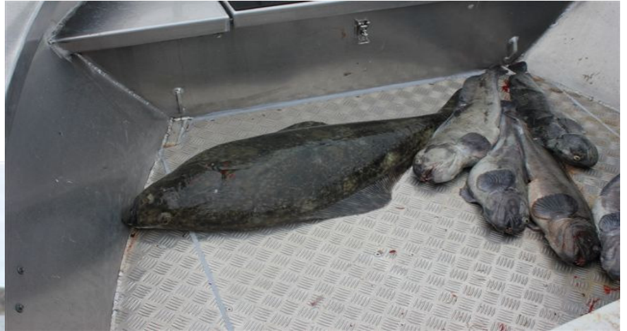
Et lille udsnit af fangsten