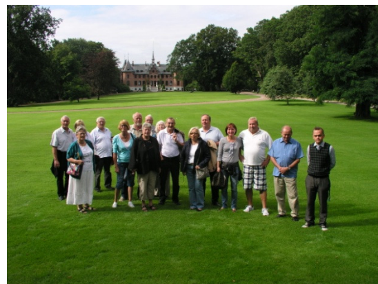
Holdet til Sofiero

Vi mødtes på Humlebæk station kl. 08.45, hvor planen var, at vi skulle med toget umiddelbart efter men her havde vi gjort regning uden vært, da toget