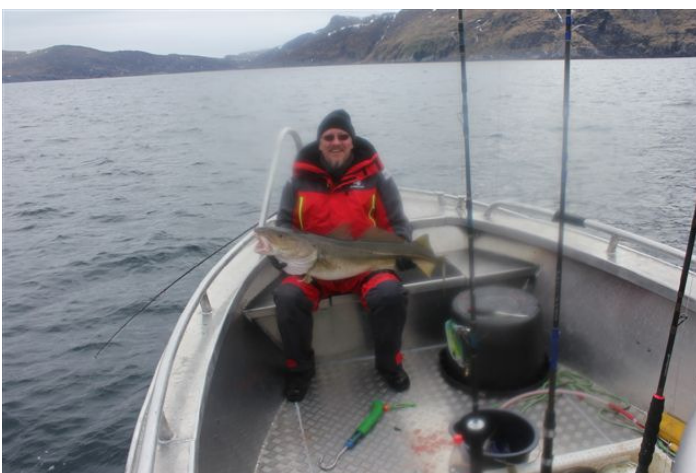
Oles Torsk på 12 kg.